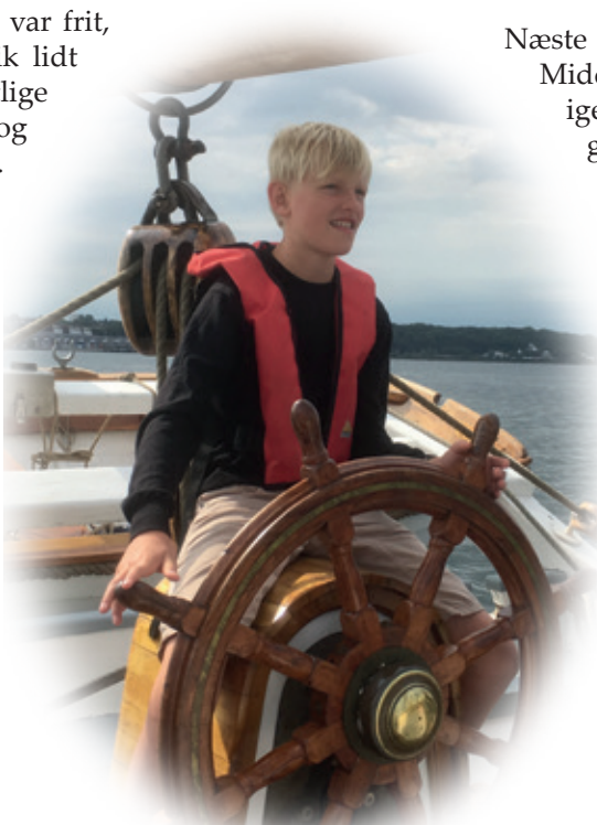
Rorgænger-slaven styrer galejen mod land, for der er is på kajen