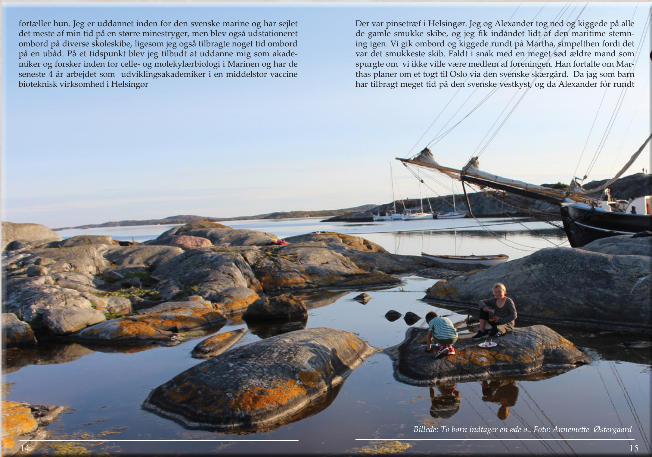
Billede: To børn indtager en øde ø..