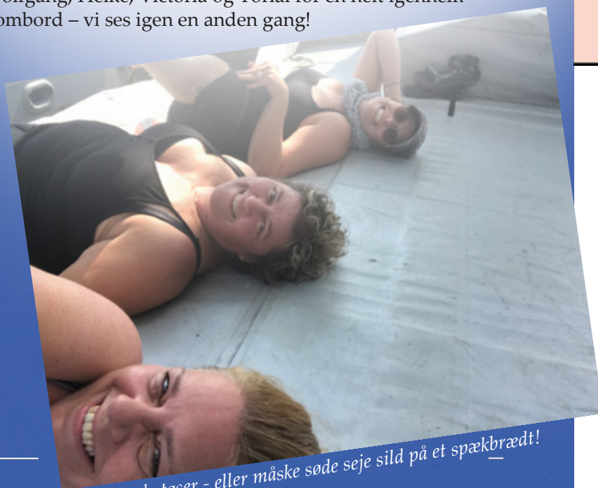
tre tossede tøser - eller måske søde seje sild på et spækbrædt!