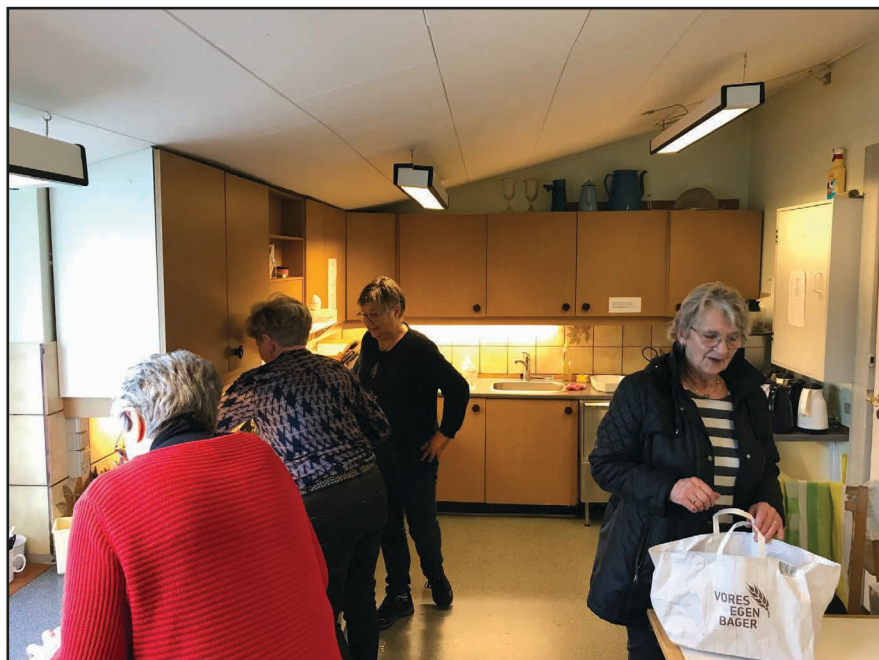
Et velsmurt køkkenhold klarede ærterne, så den kulinariske del af medlemsmødet også var på plads.

Og igen var forplejningen helt i top foretaget af både nye og erfarne medlemmer. Det begejstrede medlem takker for en, " usandsynlig berigende og vel sammensat dag."