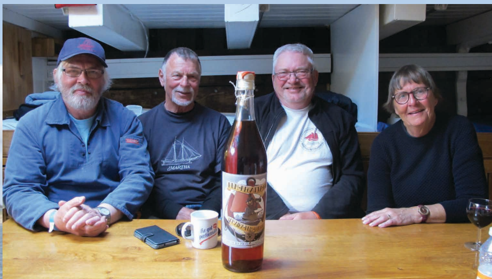
Her sidder den skuffede besætning, som kun blev nummer 2 i 2018. I 2019 har vi tænkt os af gøre det bedre og blive nummer 1 i vores klasse

Rumregattaen i Flensborg har været afholdt i mangfoldige år under devisen "Lieber heil und Zweiter, als kaputt und breiter. Es geht um's dabei sein!", som frit oversat fra plattysk betyder "Hellere hel og på andenpladsen end skadet og vinder. Det gælder om at være med!" Det betyder også at alle konkurrerer om 2. pladsen, der giver den solide præmie bestående af tre liter rom, hvorimod førstepladsen altid er en genstand af noget tvivlsom art til at pynte med derhjemme. Se mere om regattaen på www.rumregatta.de