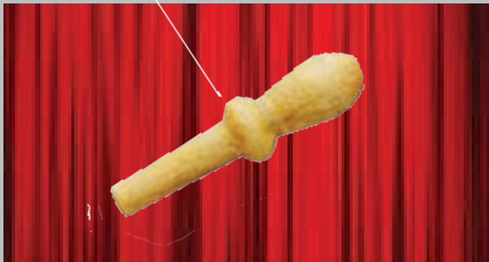
Billede: Start din indre fest ud i træarbejde med at lave en kofilnagle på de store maskiner på værkstedet.

Af opgaver der skal laves i år kan nævnes: