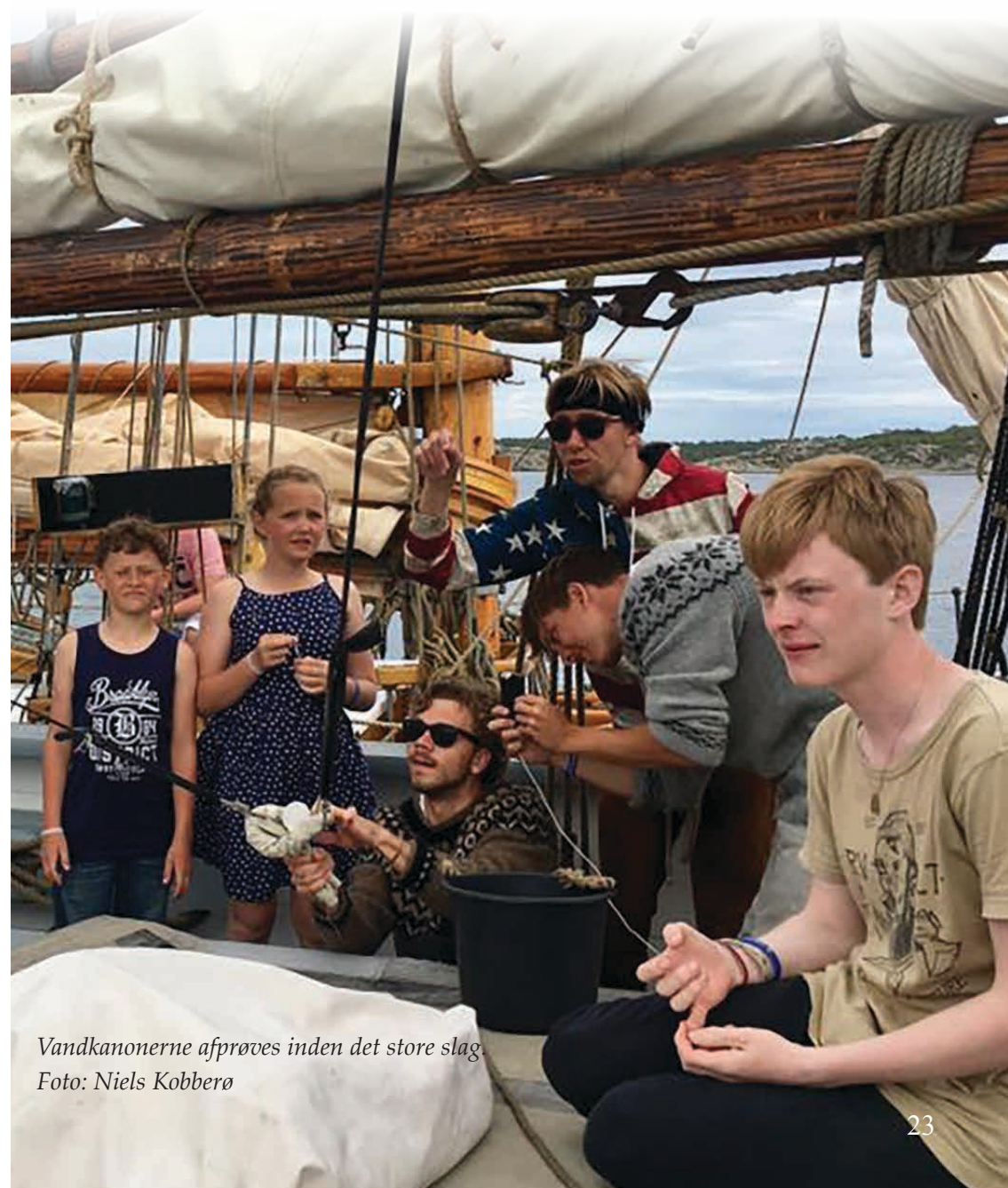
Vandkanonerne afprøves inden det store slag.