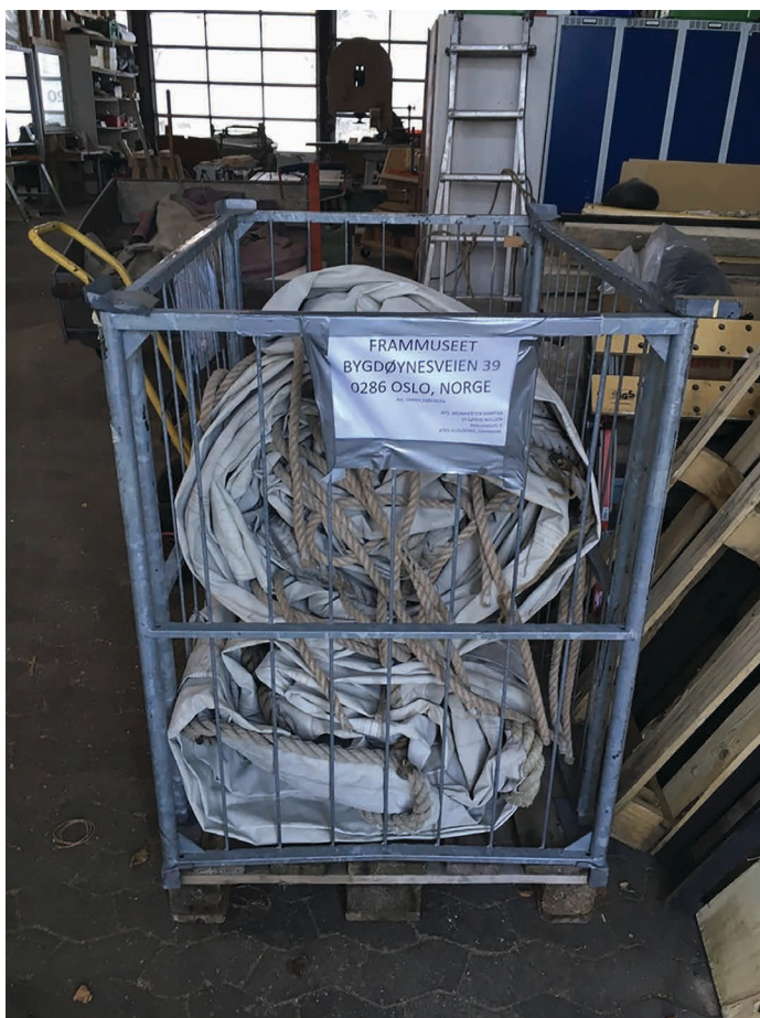
Marthas sejl pakket og klar til at blive sendt til Norge.