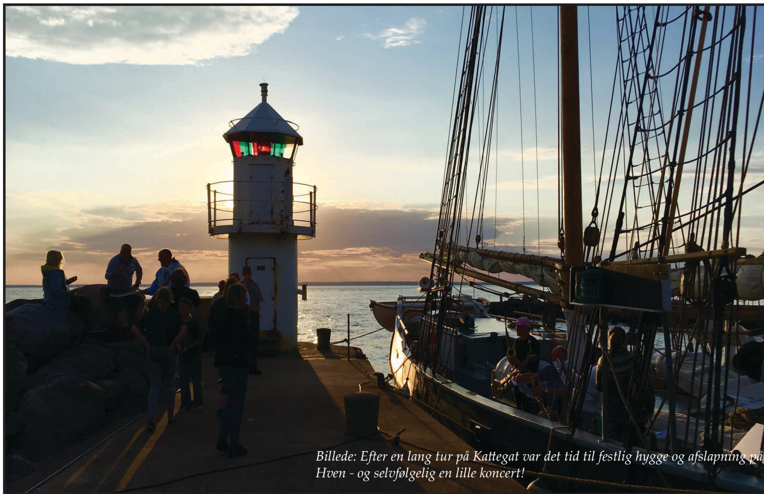
Billede: Efter en lang tur på Kattegat var det tid til festlig hygge og afslapning på Høen - og selvfølgelig en lille koncert!

Jeg har ikke før kendt til foreninger som ligner Martha, men det er da helt sikkert at man ikke kun kommer for at sejle, og slet ikke for at slappe af. For det er da noget af et arbejde, hvis der skal sejles i længere træk. Men når det er af ren lyst og glæde over hinandens selskab, så er det da helt sikkert at ens første gang med Martha næppe bliver den sidste