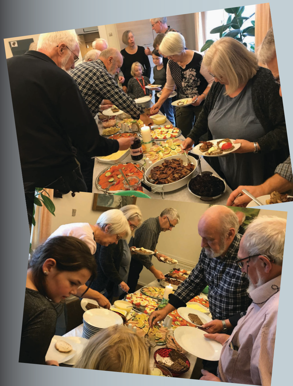
Frokosten er altid et af højdepunkterne på generalforsamlingen i Martha-foreningen.