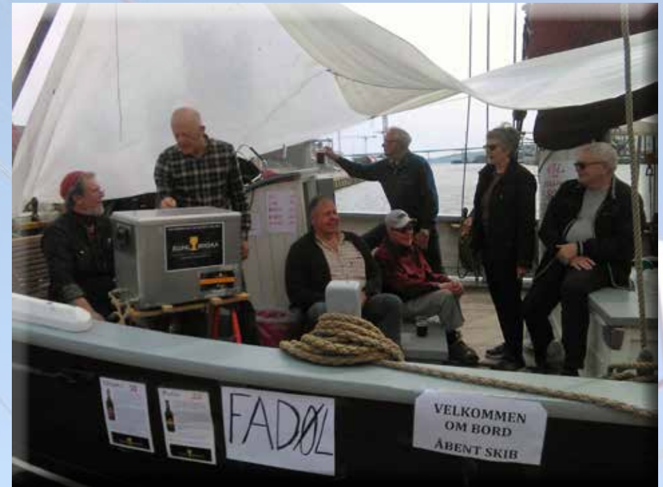
I foråret deltog Martha i Havnemarkedet i Vejle med åbent skib.

Det blev et par gode dage samt nogle indmeldelser både aktive og støtte-medlemmer. Det er efterfølgende besluttet at gentage Havnemarkedet til næste år. Marthas deltagelse afhænger af tidspunktet. Vi skal jo være 'hjemme' for at kunne deltage.