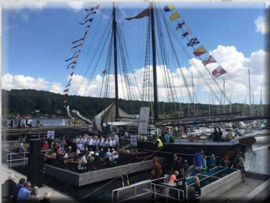
Martha havde en central placering i 'Vild med vand' i august.

Det er tanken at lade arrangementet udvikle sig til en slags by/havnefest og måske allerede til næste år både lørdag og søndag. I år var der mere underholdning med bl.a. Wafande og Shantykoeret fra Esbjerg. Sidstnævnte optrådte med Martha som baggrund, og der blev sunget så selv rigningen svingede i takt. Pausen mellem de to sæt tilbragte koeret ombord, så ølhanerne sprøjtede i de par timer. Igen havde vi mange besøgende og igen virkeligt interesserede i vores forunderlige og fantastiske forening.