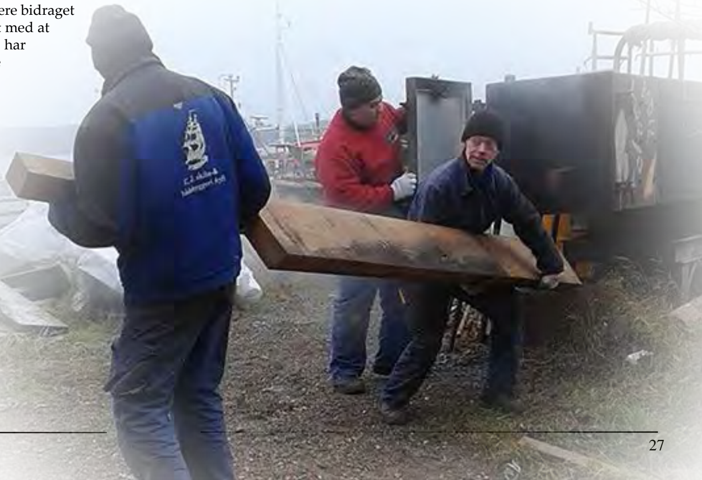
Billede: Folkene fra værftet tager en planke ud af svedekassen.

Desuden er der fremstillet nye pullerter til agterskib og tildannet resterende skanseklædning (som alligevel ikke kom i brug).