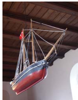
Modellen på sin plads