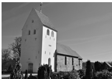
Skærup kirke i solskin