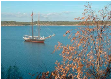
Fra den svenske skærgård

Tilmeldinger til sejlads forløber ganske fint, men der er nogle af ugeejladserne som mangler lidt tilslutning.