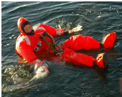
Bodil i "sparkedragten"

Dragten holdt mig fint og tør oven vande. Den er svær at manøvrere med, for det mest naturlige er at ligge på ryggen, helt passivt. Jeg håber ikke den skal i anvendelse for