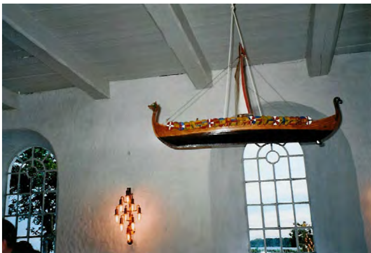
Vikingskibet i Hjarnø kirke