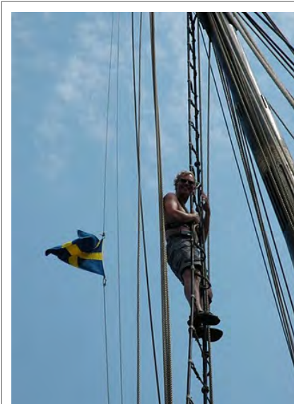
Bodil i vanterne på vej op i masten

mål i toppen. Jeg var lykkelig og stolt: At sidde i en mast og have verden for sine fødder, overskuelig og indbydende, ikke værst.