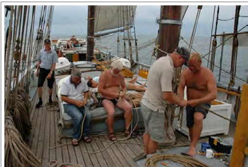
Der arbejdes flittigt med tovværk mens der sejles

Vi passerede det sted, hvor uheldige russere engang, da verdens orden var en anden,