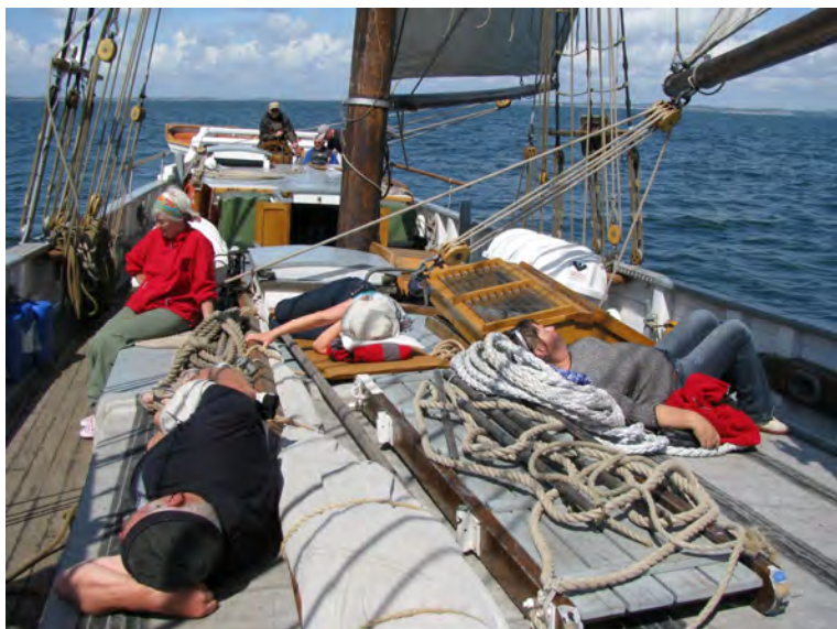
Man kan godt slappe af under en sejlads med Martha

kelte bundplanker i s.b.- side. Martha havde før forlisset en kølsprængning på ca. 16 %. Ved at fjerne understøttelsen midtskibs i ca. 14 dage lykkedes det at nedbringe denne til ca. 2 %. Kølen blev tilpasset og der isattes en 16 meter egebjælke til at forstærke kølen. Denne fastgøres til den oprindelige køl med 12 stk. gennemgående bolte. U-jern monteres fra stævnens vandlinie til kølens afslutning ved roret, som slidskinne i stedet for en stråkøl. Ligeledes forstærker U-jernet kølen, og modvirker derfor yderligere kølsprængning.