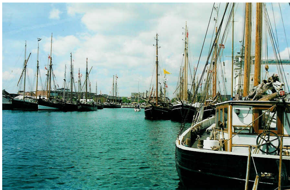
Skibe i Vejle Havn ved Marthas 100-års fødselsdag i år 2000

Du kan læse mere om hele pinsestævnet på http://www.tsa.dk/Pinsestaevne_Jubilaeum.aspx