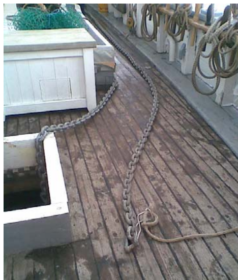
Amkerkæden gøres klar

Træningstur 5/5 - 6/6: Turen er fra Vejle til Vejle. Træningsprogrammet er det normale. Start lørdag formiddag med gennemgang af SMS håndbog og rutiner. Afprøvning i havn af de væsentlige ting. Afsejling, når vi er klar og fortsat øvelse med lænsning, brand, mand over bord, ankring, sejlføring osv. Deltagelse betyder kvalificering som grundbesætningsmedlem. Man skal deltage i et sådan træningsforløb mindst hver 3. år.