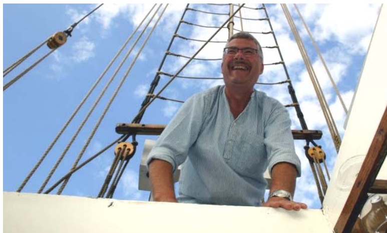
Skipperen ser ud til at være glad for sin besætning