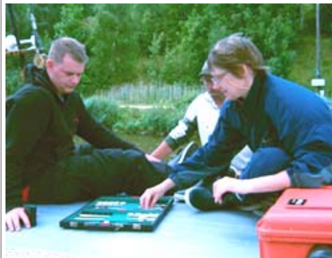
Alvorlige overvejelser under et slag Backgammon.

Hertugdømmerne, England og nu Tyskland. Med sin strategiske placering, har den spillet betydelige roller i krige og fredstider. Beboerne har været deporteret flere gange, og sidst forsøgte man efter anden verdenskrig at detonere så meget sprængstof derovre, at øen burde forsvinde. Det tog det urgamle grundfjeld sig ikke af, så øens beboere kunne flytte tilbage igen. I dag lever man af turisme.