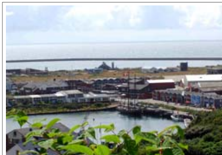
Skonnerten Martha ved oliekajen på Helgoland

Sejlturen gik - for mit vedkommende - først med solskins-dase-dage for anker ved Tunøfestival. Herefter gik det med skift af besætning i Fredericia, bunkring af vand og strøm i Middelfart direkte sydover med 5 sejl til Kiel fyr. Vinden var gunstig, og vi gik med 5 sejl og 6-7 knob i den helt rigtige retning. Ved 4 tiden skete der noget med vinden, men da var vi også ved Kiel fyr. Vi kunne gå