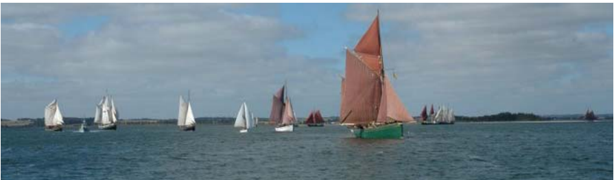
Smukt ser det ud

Jeg håber vi kan samle så mange deltagere til "Pis Potten" om lørdagen. Umiddelbart efter denne, er der afgang til Limfjorden. Vi har jo lidt travlt! Vi skal nemlig være klar i Løgstør allerede tirsdag morgen, da løbsledelsen jo har udvidet arrangementet med, at vi i år skal anløbe Nykøbing Mors. Vi slutter lørdag i Skive, og derfra sejler Vagn så den smukke dame hjem til Vejle.