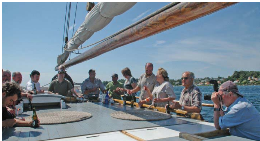
En stor kreds af marthanere nyder "Fyn Rundt" i 2008

Er du i tvivl: Kontakt Bent Hansen: Tlf. 75 25 16 79 eller 72 18 56 54