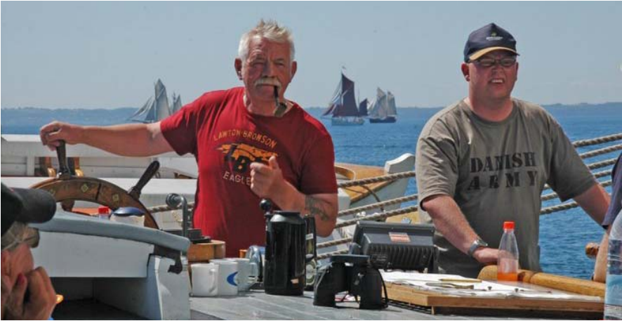
Koncentration på kommandobroen

Vi mødes i Svendborg og gør klar, og jeg regner med vi igen skal starte fra Korsør og ender så forhåbentlig igen i Svendborg om fredagen, derudover ved jeg ikke, hvilke havne vi skal anløbe. Men jeg håber vi får en god tur. Med fin vind – god besætning – jeg må jo prøve at gøre et godt indtryk, da det måske er sidste gang – nå lad os se.